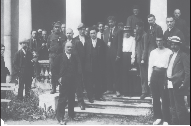
1920లో పెట్రోగ్రాడ్ లో జరిగిన రెండవ కమ్యూనిస్టు ఇంటర్నేషనల్ మహాసభకు హాజరైన ఎంఎన్ రాయ్ (మధ్యలో డెలిగేట్ బ్యాడ్జెట్ తై కట్టుకున్న వ్యక్తి) లెనిన్ (దిగువన ఎడమవైపు) మగ్సిమ్ గోర్కీ (లెనిన్ వెనుక)

భాగమని వారికి బాగా తెలుసు. అంటే అర్థం భారత కమ్యూనిస్టు ఉద్యమం ఎల్ల వేళలా బలమైన అంతర్జాతీయతా సూత్రానికి కట్టుబడి ఉంది. ఇంకో మాటలో చెప్పాలంటే అది ప్రపంచంలోని పీడిత జాతులు, పీడిత ప్రజల హక్కుల కోసం కట్టుబడి ఉంటారు, దేశం లోపల ఆ విధానం కొంత మందికి రుచించకపోయినప్పటికీ.