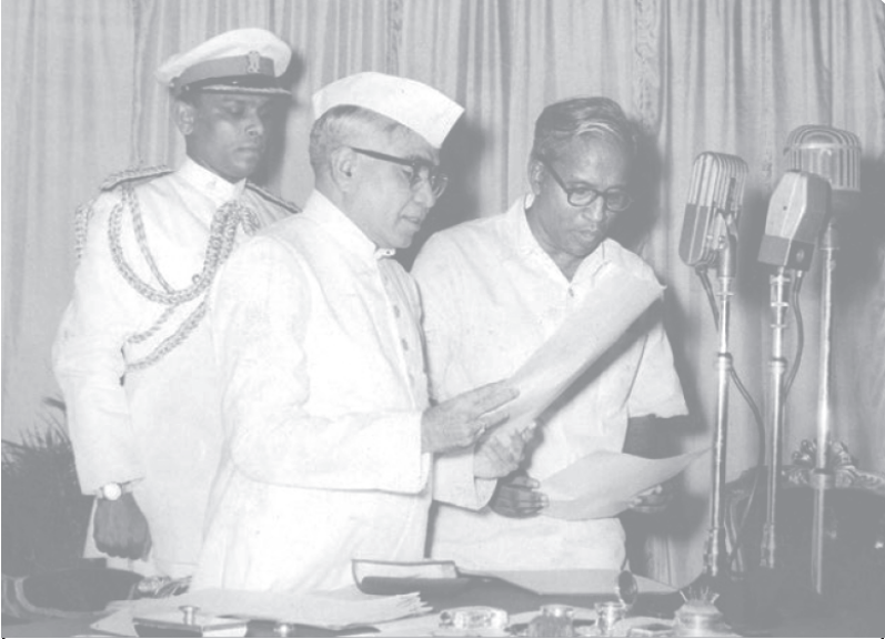
1957 ఏప్రిల్ 5న కేరళ ముఖ్యమంత్రిగా ప్రమాణ స్వీకారం చేస్తున్న కమ్యూనిస్టు నేత ఇఎంఎస్ నంబూద్రిపాద్

భూ సంస్కరణలకు తీసుకున్న చర్యలు భూస్వాముల గుండెల్లో రైళ్లు పరుగెత్తించాయి. విద్యారంగంలో సంస్కరణలను కాథలిక్ చర్చి నాయకత్వం జీర్ణించుకోలేకపోయింది. వీళ్లు రాష్ట్రంలో పెద్ద ఎత్తున ప్రయివేటు పాఠశాలలు నడుపుతున్నారు. కాథలిక్ చర్చి, భూస్వామ్య ప్రయోజనాలుగల ప్రధాన కుల సంస్థలు కమ్యూనిస్టు మంత్రివర్గానికి వ్యతిరేకంగా కాంగ్రెస్ పార్టీతో చేతులు కలిపాయి. హాస్యాస్పదంగా వాళ్లు 'విమోచనా సమరం' అనే పేరుతో ఆందోళన నిర్వహించారు. కేంద్రంలోని కాంగ్రెస్ ప్రభుత్వం దీన్ని అవకాశంగా తీసుకుని 1959లో కేరళలో కమ్యూనిస్టు మంత్రివర్గాన్ని రద్దు చేసింది.