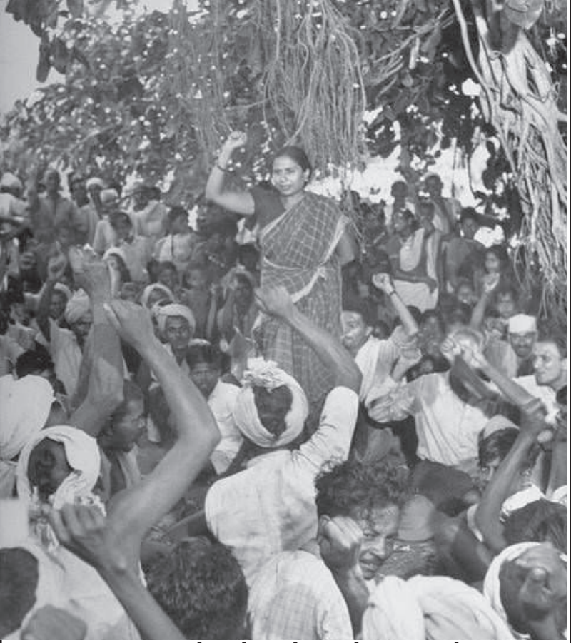
మహారాష్ట్రలోని ధానే జిల్లాలో 1946లో తిరుగుబాటు చేస్తున్న పక్షి ఆదివాసీలనుద్దేశించి ప్రసంగిస్తున్న కమ్యూనిస్టు నాయకురాలు, అఖిల భారత కిసాన్ సభ (ఎఐకెఎస్) నేత గోదావరి పరులేకర్

ఆంధ్ర, తెలంగాణ, తమిళనాడు, కేరళ, మహారాష్ట్ర, బెంగాల్, అస్సాం, త్రిపుర, కాశ్మీర్ లో రైతాంగ స్త్రీ, పురుషులను పెద్ద ఎత్తున పోరాటాల్లోకి సమీకరించడం జరిగింది. ఈ సమీకరణలు పాలక వర్గాల పునాదులను కదిలించాయి. దాంతో వారు ఈ పోరాటాలను అణచివేయడానికి వారు తీవ్రమైన నిర్బంధకాండ ప్రయోగించారు. చివరికి రైతాంగం తాము పోరాడుతున్న అనేక హక్కులు సాధించుకోగలిగారు. దానివల్ల కమ్యూనిస్టు ఉద్యమం మరింత బలపడింది.