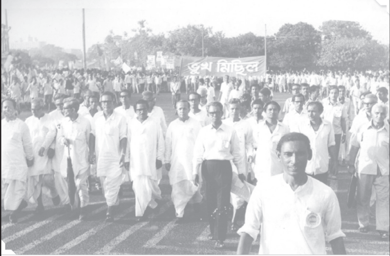
1959లో పశ్చిమ బెంగాల్‌లో జరిగిన ఆకలి యాత్రలో పాల్గొన్న కమ్యూనిస్టు నాయకుడు జ్యోతి బాసు (ఎడమ నుండి ఆరవ వ్యక్తి)

చేసింది. అప్పటినుండి 34 సంవత్సరాలు పశ్చిమ బెంగాల్‌లో కమ్యూనిస్టుల నాయకత్వంలో ప్రభుత్వం అప్రతిహతంగా కొనసాగింది.